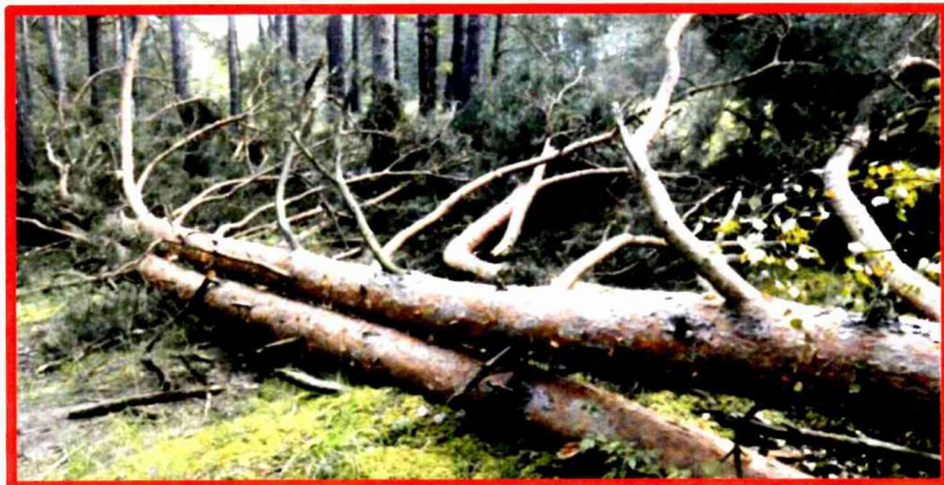
Лежащее на поверхности земли ветровальное дерево, не имеющее признаков отмирания. Не является валежником

Кроме того, необходимо обратить внимание, что деревья, которые лежат на земле, но не имеют признаков естественного отмирания (имеют зеленую листву или хвою), определять как «мертвые» не допускается (смотри изображение № 5).